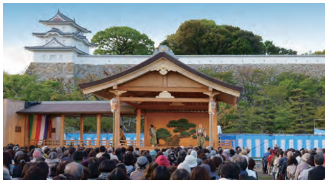
明石城築城400周年記念事業