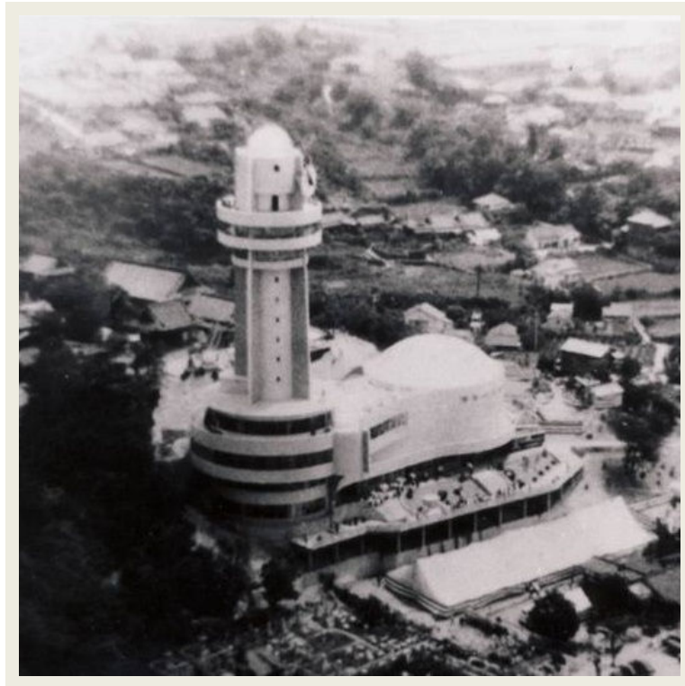
昭和35年、開館当時の天文科学館